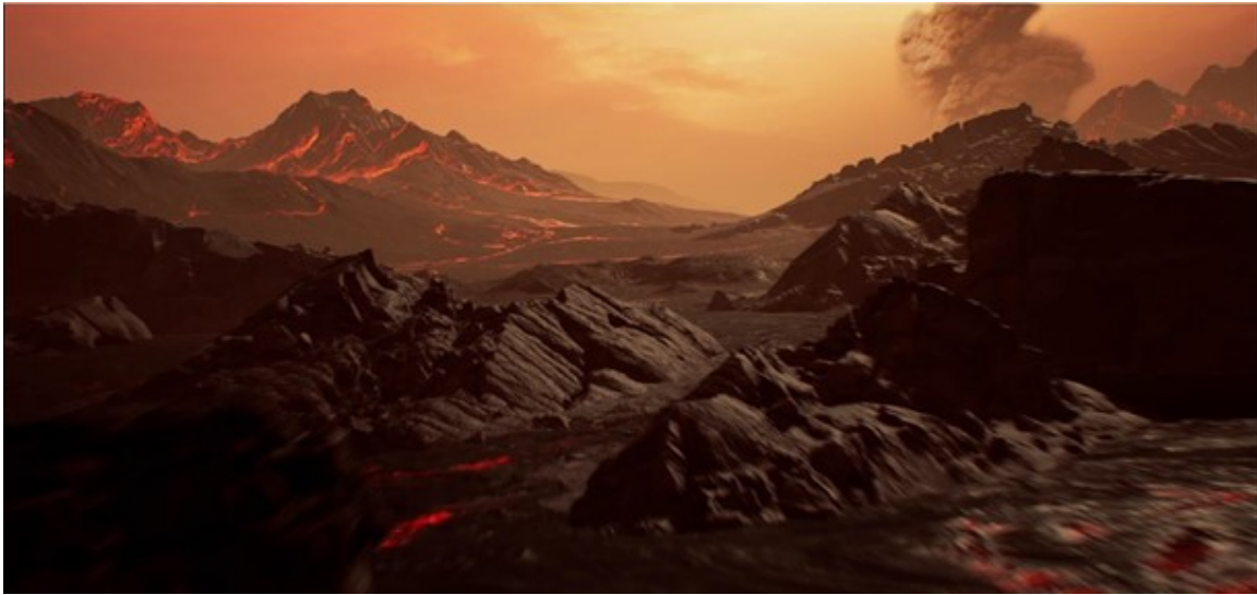
Imagen 1. Impresión artística de la superficie de Gliese 486b. Créditos: RenderArea ( https://renderarea.com/ ).